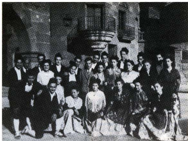
El Grup Folkloric d'Horta al «Poble Espanyol», de Barcelona el 5 de juny de 1948