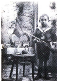
Amb les joguines dels Reis