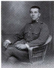
A Mataró, l'any 22, fent-hi el soldat

Entraria com a soci als Lluïsos, al més tard, l'any 1916. Hi entrà de ple, amb entusiasme, voluntat i encert. Tant foren reconegudes les seves aptituds, que l'any 21 fou sorprenentment nomenat president, el més jove que ha tingut l'entitat al llarg de la seva existència. Vice-president diverses vegades, fou sempre un col·laborador callat, però efectiu, del president de torn. Després de la guerra, ocupà la vicepresidència des del 41 fins al 48 i, altra vegada, del 52 al 56.