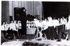
Concert al C.P. d'Horta de la Banda Municipal de Barcelona