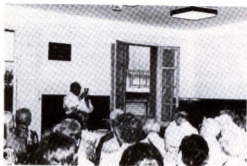
Un moment de la missa celebrada, el dia de Sant Lluís Gonçaga, a la sala de ping pong dels Lluïsos

l'estupenda tasca de tipus social que porta a terme, car moltes de les persones que hi participen troben aquí un lloc per a realitzar-se i per a compartir unes hores amb altra gent.