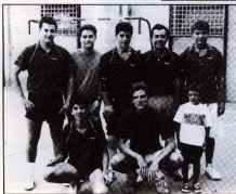
Torneig Inter-Seccions: Futbol. Equip representant Tennis Taula. Juliol 1991.