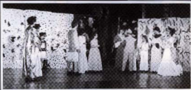
L'emisferi fantàstic. Grup infantil de teatre. 9 juny 1991.