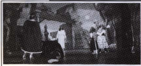
Els Pastorets de l'Esbart. 22 desembre 1991.