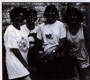
Torneig Inter-Seccions: Bàsquet. Equip representant el Teatre. Juliol 1991.