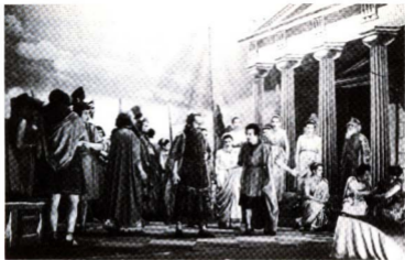
Una escena de Periandre , en la funció inaugural del nou teatre, el 25 de març de 1951