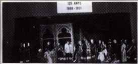
El rei que no reia. Antics i nous actors dels Lluïsos. Sant Lluís 1991.