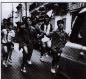
Arribada de la Flama del Canigó. Portadors: Agrupament Escolta Fleming. Sant Joan 1991.