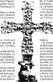
Cimbell de la bandera donada a la Parròquia. Fou cisellat fa uns 70 anys per l'artista hortenc Sr. Joaquim Ros i Botarull. Primer llui al capdamunt de la bandera del grup d'Horta dels Pomells de Joventut de Catalunya i, al cap d'anys, a la de la Federació de Joves Cristians.

El president del Consell Comarcal del Barcelonès donà les gràcies als que amb les seves paraules i obres ajudaven a aprofundir en les arrels de la Federació a fin d'assahonar-les en aquest 60è aniversari. Agraí als assistents la seva presència i al Centre la seva gran acollida. Comentà el simbolisme dels darrers actes i digué que encara que lamentava que no s'haguessin trobat les banderes de les noies i aspirantes d'Acció Catòlica, teniem la gran sort de veure que aquelles noies eren allà, al peu del canó, i que ens encoratjaven