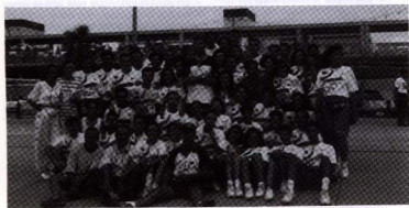
Els voluntaris olímpics del Port, amb el príncep Felip i la Cecília Font

Confiscàrem tres botelles de begudes alcohòliques, cosa que ens féu molta gràcia en ser la primera vegada que interveníem en aquestes tasques. També vàrem confiscar llunes de begudes i banderes, que no estaven permeses en aquells moments. Tot i la prohibició, entraren moltes banderes a l'Estadi. La gent se les embolicava al cos, sota les camises o els vestits. Dins l'Estadi, eren els policies qui les confiscaven. Després, durant els Jocs Olímpics, els controls eren diferents. Les banderes eren permeses, però no les begudes. Vaig estar 27 dies al Port Olímpic: de l'11 de juliol al 6 d'agost. Fou meravellós! Teníem contacte directe amb els atletes i l'ambient era maquíssim. Cada dia hi havia unes festes, que allò era massa, un «desfate total»! Molt dies vam veure el príncep Felip i fins podíem parlar amb ell. Si li parlaves català et contestava també en català, encara que amb un accent castellanitzat. La infanta Cristina també és molt senzilla i simpàtica. Moltes vegades deixaven la zona de VIPs i es passaven a la zona de voluntaris i dinaven amb nosaltres, el mateix que els atletes de tots els països. Han passat tantes personalitats amb les qual hem