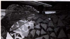
Dansaire del nostre Esbart fent d'ona a la Descoberta de la Mediterrània

Després vindrà la Festa Major d'Horta, amb l'actuació del Cos de Dansa a la plaça de Santes Creus, on esperem retrobar-nos, passades les vacances.