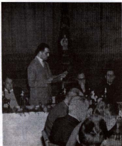
Pronunciant el seu discurs en el comiat dels germans Tena.