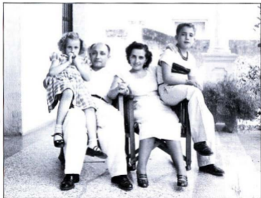
La família Solé i Solé, a Santiago de Cuba

—Faig la carrera de pèrit industrial mecànic i la d'enginyer tècnic.