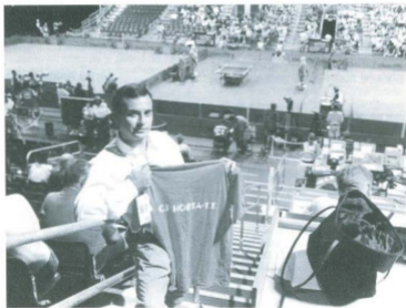
Els Lluïsos d'Horta, als Jocs Olímpics d'Atlanta 1996