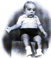
"Em diuen que sempre estic igual, que no he canviat..."

projectes. L'estudi als Salesians era molt bo i s'hi aprenia força, però l'ambient era lúgubre. Alguns professors semblaven nazis. N'hi havia un que li dèiem "La Gestapo", perquè apallissava la gent i posava càstigs molt durs.