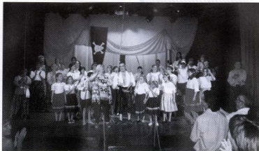
Pedaços. Tota la companyia, després de Mar i cel .

L'escena de Somriures i llàgrimes , lligada al final amb el cant dels joves nazis ens ha fet esgarriar d'emoció, ens ha convulsionat! I per fi, la posada en escena del vaixell de Mar i Cel ha estat el botó d'or de tot el spectacle.