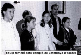
Equip femení sots-campió de Catalunya d'escacs