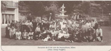
Excursió de fi de curs de Manualitats, Ribes