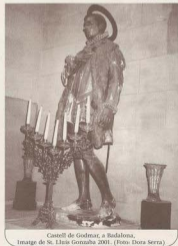
Castell de Godmar, a Badalona, imatge de St. Lluís Gonzaga 2001.