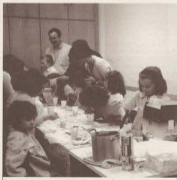
Els cuiners infantils.