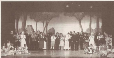
Mary Poppins. 15,16 juny 2002