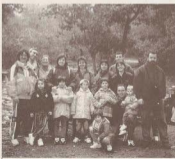
Grup de caminadors Parc Natural de Sant Llorenç 14/04/2002

Dissabte 29 de juny comença la sortida de Barcelona i poc a poc va arribant tothom al punt de trobada, però cap a les 11:30 ens telefona la Núria —sort dels telèfons mòbils!— per dir-nos que té el cotxe espallat abans de