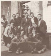
Sortint de missa de l'Església de Riells 1946