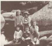
Llac de Malniu Meranges 30/06/2002

Diumenge 30 de juny a les 7:00 es comencen a despertar els primers, i a poc a poc tothom es va aixecant. Després de recollir les coses i comentar la nit que hem passat amb els veïns de casa, esmorzem i cap a les 10:00 sortim amb els cotxes cap a Meranges. A les 11:00 arribem a l'aparcarament i després de pagar l'import de 2 euros per cotxe per aparcar, ens abraçuem i comencem