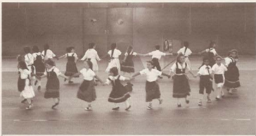
Grup preparatori al Polisportiu de Premià de Dalt