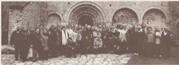
Excursió a la Vall d'Aran. El grup davant l'església de Salarú