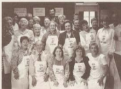
Aquí teniu a la plantilla de cuineres i cuiners, al complet.