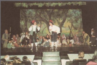
Dimonis i Pastorets.