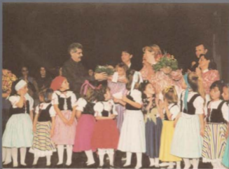
Festival de Nadal. Esbart Folkloric d'Horta