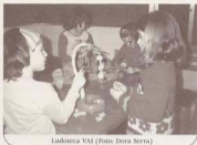
Ludoteca VAI

nostre Tió, ja va fer de les seves menjant-se totes les galetes que els més menuts li donaven.