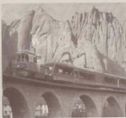
el cremallera l'any 2003

va estabrir un bon patiment. No he oblidat aquell dia terrible. Molt de temps vaig patir d'insomni. Molts anys van passar abans no vaig tornar a pujar a la Muntanyal El pare, que ja havia perdut un fill de disset anys abans que passés aquell accident, va quedar tan afectat que a mi em super-protegia i no volia sentir parlar ni de trens ni d'anades a Montserrat.