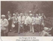
Les Fougues de la Fou