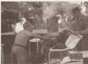
Festa al carrer

s'estan coent en una barbacoa instal·lada a tocar de la paret de can Caparrada).