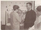
Una lliçó de "frivolitat"

I també comptem com a Festes de Sant Lluís el fi de curs de danses, i el de Manualitats i el de totes les seccions, perquè ara ja fa massa calor i necessitem fer un respir!