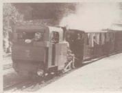
el cremallera l'any 1905

No tornàrem a casa fins a última hora de la tarda. Patim en pensar que el pare s'hauria assabentat de la desgràcia i ens estaria cercant. Però el pare havia treballat tot el dia i no sabia res. Quan va arribar a casa amb el diari del vespre sota el braç estava serè i tranquil. No havia mirat la terrible capçalera d'aquell diari. Es