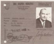
Fitxa federativa de l'any 1969

Fou jugador, delegat, entrenador, acompanyant de jugadors, promotor de torneigs, retolador oficial i col·laborador incansable dins la nostra secció.