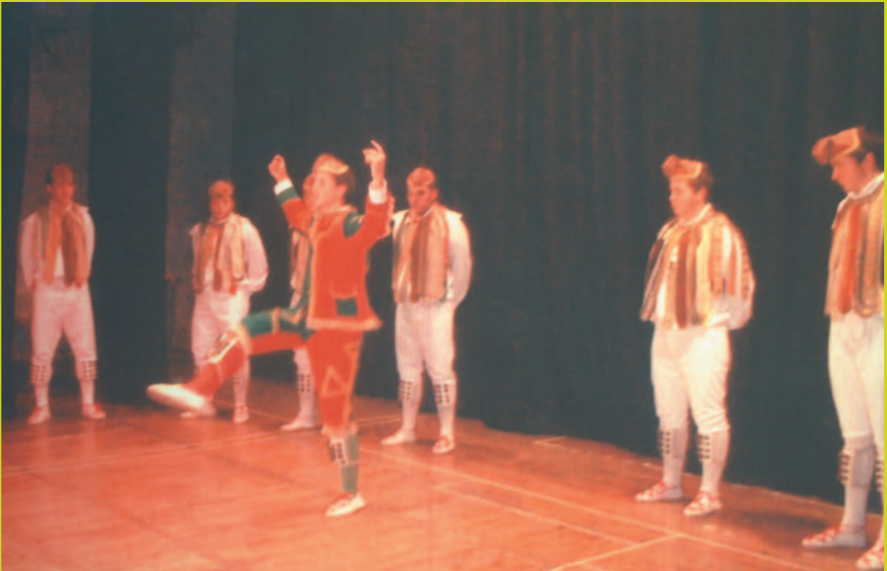
"Danzantes de Ochagavia", convidats de l'Esbart Folklòric