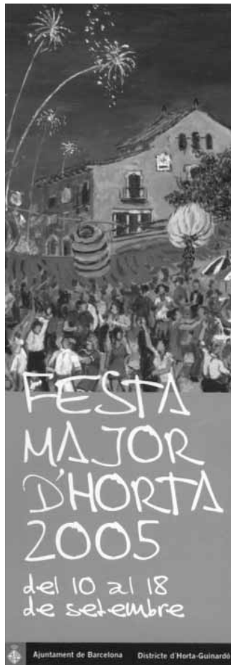
Ajuntament de Barcelona Districte d'Horta-Guinardó

2) Però sobretot proposo Can Fargas perquè, a banda de la discredició, facilitarà el consens amb