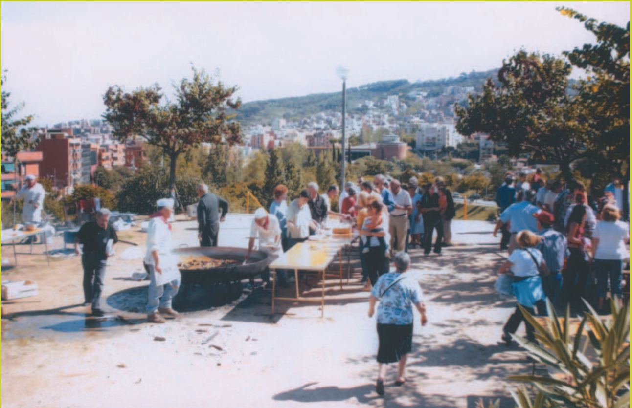
Arrossada de la Festa Major