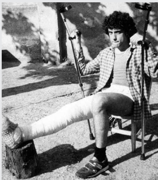
1983 Primera operació de genoll