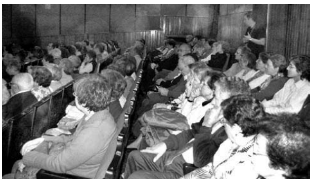
Una sala sempre ben plena de públic

L'èxit entre els centres escolars ha estat espectacular, amb aforaments que omplien la platea i l'amfiteatre i una pel·lícula, Cometas en el cielo , tan sol·licitada que, fins i tot, ha calgut duplicar el nombre de sessions previstes.