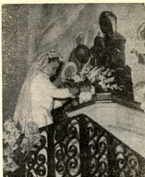
Juegos Florales. La «Reina d'amor» ofrece un ramo de flores a la «Moreneta».

Naturalmente, las réplicas, en forma de ciertas preguntas, no se hicieron esperar. Por ejemplo: