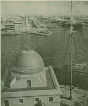
En el extremo norte del Canal, en Port-Saïd, los buques que provienen del Mediterráneo pasan ante el faro (arriba) y la torre de la policía marítima (centro).

Se fijó el presupuesto total de las obras en 185 millones de francos y la duración de las mismas se estableció en seis años; los ingresos de la explotación se previeron en 30 millones anuales, a razón de un derecho de paso de diez francos por tonelada.