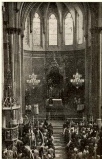
Una vista de la nostra Església Parroquial en l'Ofici Solemne del diumenge de Rams. Poden apreciar-se en l'altar major les dues noves làmpares, ofrena d'un benvolgut feligrès, que tant ajuden a resaltar l'esplendorositat del nostre Temple.

Estimar, doncs, a Déu sobre totes les co-