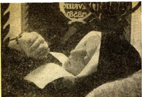
El cuerpo incorrupto de Santa Bernadette.