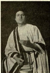
FIGURAS DE «LA PASSIÓ»

Como un clamor de triunfo radiante fulguran en el escenario los dos bellísimos nuevos cuadros de la «Resurrección» y la «Ascensión gloriosa». Dos nuevos éxitos de presentación, plasticidad y maquinaria que aportan al Sacro espectáculo una superación definitiva. Las vibrantes notas del «Aleluya» de Haendel y la satisfacción dibujada a fuertes trazos en los rostros de los espectadores,