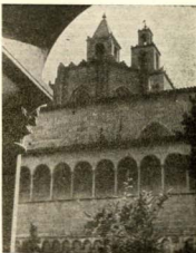
El monasterio de San Cugat del Vallés. Una de las mejores obras arquitectónicas de nuestra tierra.

Terminóse la revisión con el rezo de ritual, a la una y cuarto de la tarde.