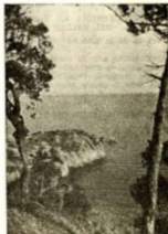
¡Ha llegado la primavera! Su sonrisa se adelanta lo mismo en la montaña que en el mar.

Reciban todos con sus respectivas familias nuestro más sentido pésame, y rogamus a todos nuestros amigos les tengan presentes en sus oraciones.