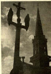
En todas partes y siempre...

O bien el de aquella joven, que por lo visto no quería ser del epoble ingrato, pues al hacer Pilato la pregunta acostumbrada: «A qui voleu que perdonis, automáticamente exclamó, en medio del impresionante silencio de la Sala: «¡A Jesús!», como si el Pretor, tanto ahora como entonces, hubiera podido mixtificar el papel que tenía asignado.