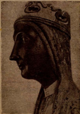
NUESTRA SEÑORA DE MONTSERRAT