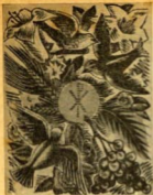
Una fecha memorable: La 1.ª Comunión