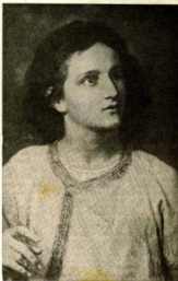
«Jesús joven, el obrero de Nazaret, nuestro jefe y modelo»