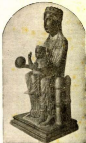
«Dels catalans sempre sereu Princesa»