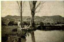
De la reciente excursión Centelles - Valldeneu

La devoción a la Virgen nos salvará. Palabra, pues, de practicar muy bien este Mes de Mayo.