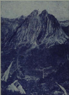
"ELS ENCANTATS I L'ESTANY DE SANT MAURICI" uno de los parajes más bellos del Pirineo catalán