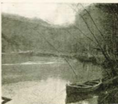
Reminiscencias del camping