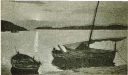
Tiempo de verano: Sugestión del mar