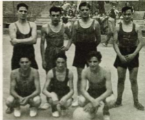
El equipo HORTA B, campeón de la Copa JACE

Para solemnizar la conquista del título de campeones de la Copa JACE y al mismo tiempo inaugurar algunas de las mejoras en plan de iniciación en nuestro campo, celebróse el domingo día 6 de julio, por la tarde, un festival deportivo, en el que tuvimos el honor de contar entre nosotros al Padre Millán, iniciador y propulsor del baloncesto en España. Se celebraron dos partidos, en el primero de los cuales nuestro Horta B fué vencido por el Pompeya.; siguiendo después el que enfrentó al potente equipo Barcelona B contra nuestro primer equipo. Este partido fué uno de los mejores