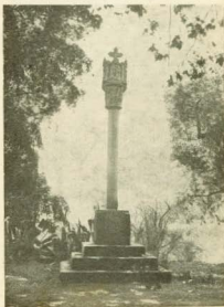
El que podria ésser la nostra Creu de Terme