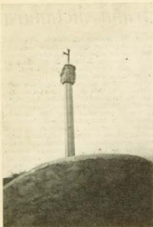
L'actual Creu del Terme d'Horta