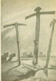
Desoladora estampa de Pasión, propicia a múltiples aplicaciones y sugerencias.