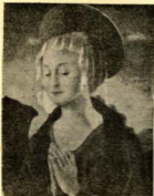
Una bella estampa mariana

que hay que asistir obligatoriamente. Por ser una hora fácil y por su corta duración, esperamos de todas las asistencias a este acto de máxima trascendencia para nuestra formación.