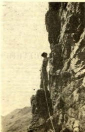
Audacia juvenil. Como si escalara el cielo...

Círculos de Estudio. — Hemos empezado unas encuestas interesantísimas y de temas llenos de actualidad que atraen en seguida el interés de los asistentes. Os esperamos, todos los jueves a las diez de la noche. Venid, que no os arrepentiréis.