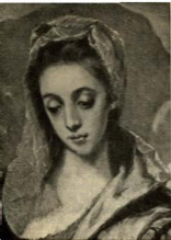
La Purísima (Pintura del Greco)