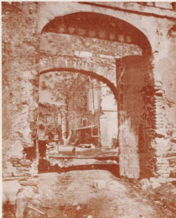
"PORTALADES DE CAN TRAVI"

Primer Premio en el Concurso Fotográfico del Centro Parroquial faro de Miguel Saucedo