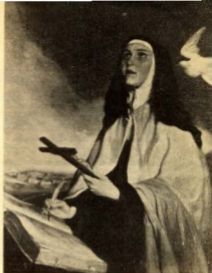
Santa Teresa de Jesús

¡Ay qué vida tan amarga do no se goza el Señor! Porque si es dulce el amor, no lo es la esperanza larga: