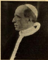
Su Santidad Pio XII

423 millones de católicos. —Basándose en informes de la agencia católica suiza C.I.P.A., la radio vaticana anuncia que, durante el período de 1926 a 1939, la población católica del mundo creció de 394 millones a 423 mi-