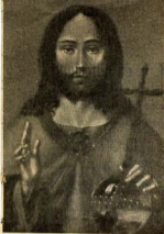
He aquí la imagen de Cristo-Rey, cuya solemnidad celebramos estos días