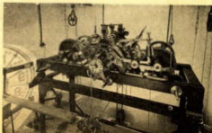
Maquinario del nuevo reloj

(Datos facilitados por su constructor Sr. P. Serra.)