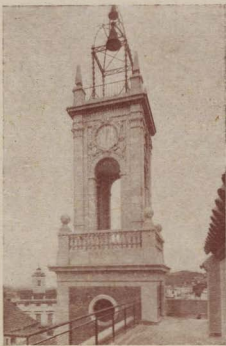
¡Aleluya! ¡Horta tiene nuevo campanario!