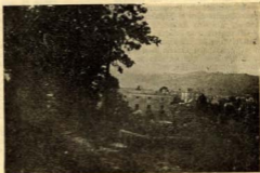
«Can Paguera»