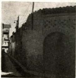
Lugar donde se instaló el Centro en 1866

Hace justamente 85 años que nuestros abuelos fundaron el Centro Moral Instructivo, el segundo Centro Católico que aparecía en lo que hoy es ciudad de Barcelona, instalando su domicilio social en un desartado local emplazado en la plazoleta situada al final del callejón Alta de Mariné, lugar desconocido sin duda por la inmensa mayoría de nuestros vecinos.