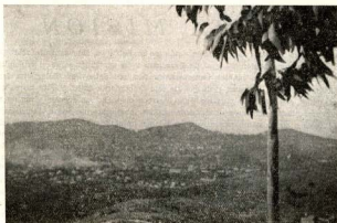
Julio 1936. Vista dels «Lluïsos» cremant

Un día de julio de 1936... El objetivo captó a distancia esta, aunque bella, trágica panorámica —probablemente la única obtenida— de la quema de nuestros antiguos «Lluïsos». Con el corazón sobrecogido contemplábamos entristecidos estas columnas de humo—tan frecuentes en aquella época— procedentes del fuego devastador con que se intentó acabar con tradiciones y costumbres arraigadas durante 70 años en el alma de nuestra barriada. Infinidad de voces de condolencia de gentes de todos matices y colores han llegado hasta nosotros expresando el disgusto y disconformidad que aquel acto les causó: «No sé per què els han hagut de cremar els Lluïsos!», fué el comentario unánime oído por calles y plazas, después e incluso durante aquellos trágicos sucesos... Llegó 1939... Un puñado de hombres de buena voluntad, mientras se recuperaba nuestra juventud desparramada por los distintos teatros de batalla, pero unidos todos en un mismo Ideal: la fe en Cristo