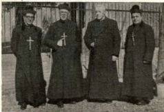
Nuestro Cura Párroco con los Rdoes. Padres Misioneros.

Pero no nos engañemos, ¡no nos deslumremos con el espejismo de estas jornadas! Pensemos, en primer lugar, que son muchos los que han deseado la voz de Dios; unos porque han escuchado pasivamente, como si el problema de su salvación no les afectara; otros, porque ni han querido escuchar siquiera. Y pensemos también, que lo importante, para todos aquellos para los cuales la Santa Misión