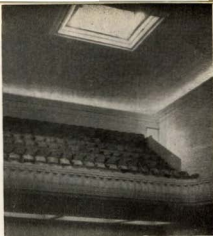
Un detalle de la esplendorosidad del nuevo Centro. Vista parcial del anfiteatro.

Y no es que lo propaguemos por presunción ni ostentación, sino que nos satisface por lo que significa de acogedor, comodidad y mejoramiento en las instalaciones, tanto de