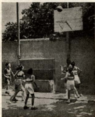
Una jugada en el partido de baloncesto que disputaron en honor de los antiguos alumnos dos equipos del colegio. ¡Lástima de campo!

Asociación Horta cuenta ya con un equipo de baloncesto pero no tiene campo. (El patio del colegio no tiene condi-