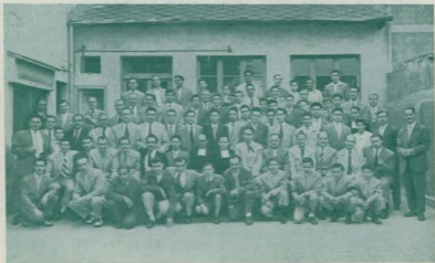
Asistentes a la Fiesta anual del Antiguo Alumno de los Hermanos de las Escuelas Cristianas, organizada por "La Salle-Asociación Horta", y que tuvo lugar brillantemente el pasado día 11 de julio.