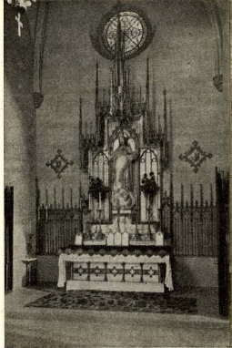
Altar del Sagrado Corazón.

En este último día tuvo lugar, a las ocho de la mañana, la Misa de Comunión general, a la que asistió inmensa muchedumbre de fieles.