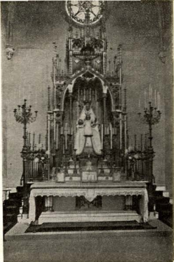
Altar de Nuestra Señora de Montserrat.

Mas no fué así. Considerando como cosa muy propia la iglesia parroquial y sintien-