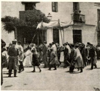
El Excmo. y Rdmto. Cardenal Casañas hace su entrada en nuestra barriada para bendecir la primera piedra de nuestra actual Parroquia.

ser colocado, es de estilo gótico, con una aguja central elegantísima. Consta de la mesa para la celebración del santo Sacrificio, encima de cuyas gradas hay un sagrario para la exposición, de líneas finísimas, al cual se sube por una cómoda escalera que se extiende por cada lado de la mesa, adornada por una barandilla de metal dorado, primorosamente trabajada. Detrás de la escalera se levanta majestuo-