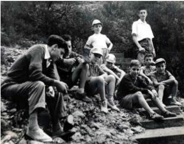
En Josep fent de monitor dels escolans de Cervellò

També ha dedicat moltes hores als Lluïsos, des de fer de president fins a ocupar-se d'obres teatrals que han deixat una bona empremta a Casa nostra.